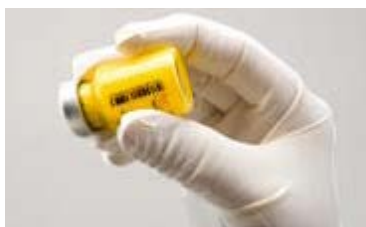
Figur C: Ryst hetteglasset kraftig

Dersom det dannes skum, la hetteglasset stå til skummet forsvinner. Dersom produktet ikke benyttes umiddelbart, skal det rystes kraftig for å suspendere. Tilberedt ZYPADHERA er stabilt inntil 24 timer i hetteglasset.