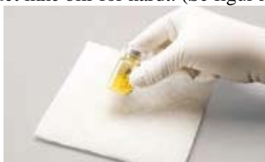
Figur A: For å blande; bank fast mot underlaget