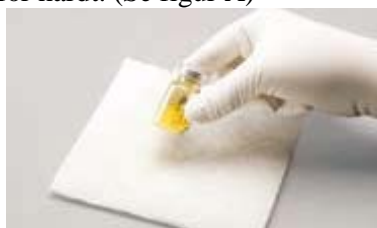
Figur A: For å blande; bank fast mot underlaget