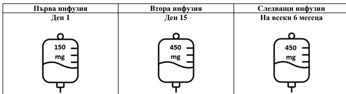
Фигура 1: Доза и схема на прилагане на Briumvi

Следващите дози Briumvi се прилагат като единична интравенозна инфузия на 450 mg на всеки 24 седмици (Таблица 1). Първата следваща доза 450 mg трябва да се приложи 24 седмици след първата инфузия. Трябва да се поддържа минимален интервал от 5 месеца между всеки две дози Briumvi.