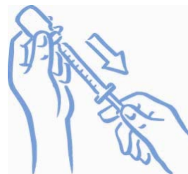
Obrázek 5: Natáhněte správnou dávku