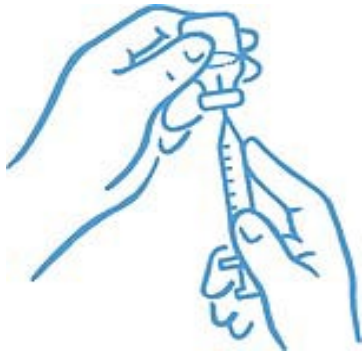
Figure 4 : Pointe dans le liquide