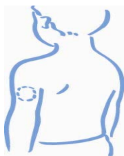
Haut du bras