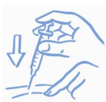
Figure A : Pincez légèrement la peau et injectez comme on vous l'a appris.