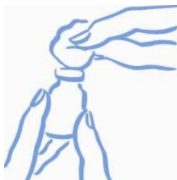
Figure 1 : Coton imbibé d'alcool sur le bouchon