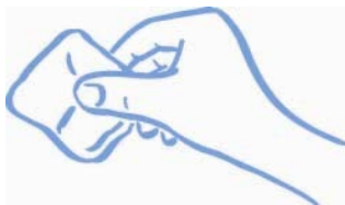
Slika B: Pritisnite (ne drgnite) z gazo ali vato