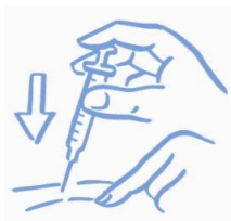
Slika A: Kožo rahlo stisnite v gubo in injicirajte kot vam je pokazal zdravnik