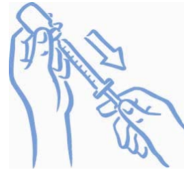
Slika 5: Izvlecite ustrezen odmerek