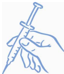
Slika 7: Brizga pripravljena za injiciranje