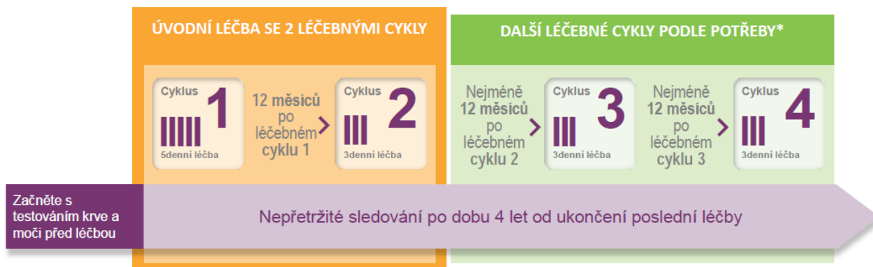
Schéma uvedené níže srozumitelně ilustruje dobu trvání účinků léčby a dobu nutného sledování.

*POZNÁMKA Studie sledující pacienty po dobu 6 let po podání první infuze (cyklus 1) prokázala, že většina pacientů nepotřebuje další léčbu po 2 úvodních léčebných cyklech.