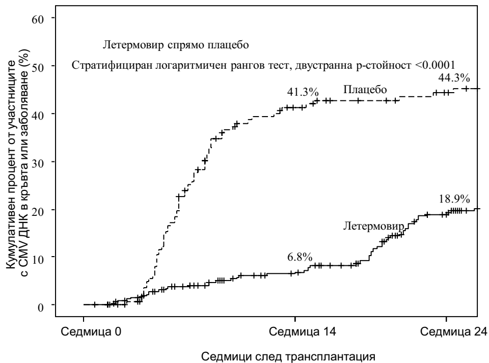
Фигура 1: P001: Карпан-Меier графика на времето за започване на анти-CMV PET или начало на CMV болест на крайните органи до 24-та седмица след трансплантацията при HSCT реципиенти (FAS популация)