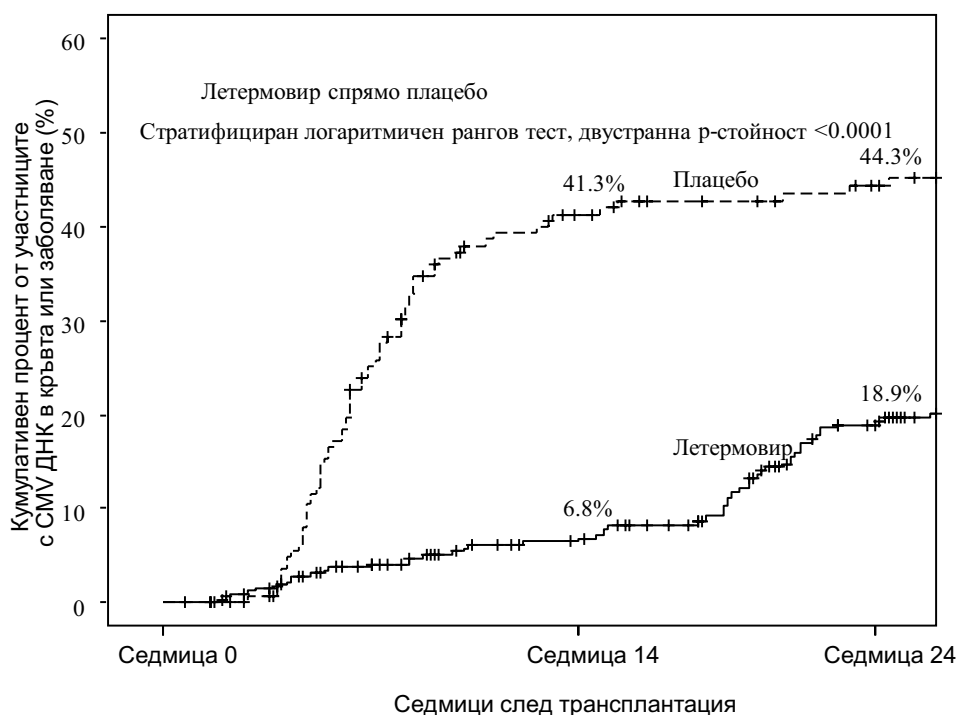
Фигура 1: P001: Kaplan-Meier графика на времето за започване на анти-CMV PET или начало на CMV болест на крайните органи до 24-та седмица след трансплантацията при HSCT реципиенти (FAS популация)

Факторите, свързани с наличие на CMV ДНК в кръвта след 14-та седмица след трансплантация при лекувани с летермовир участници, включват висок риск за реактивиране на CMV на изходно ниво, наличие на GVHD, употреба на кортикостероиди и донор с отрицателен серумен резултат за CMV.