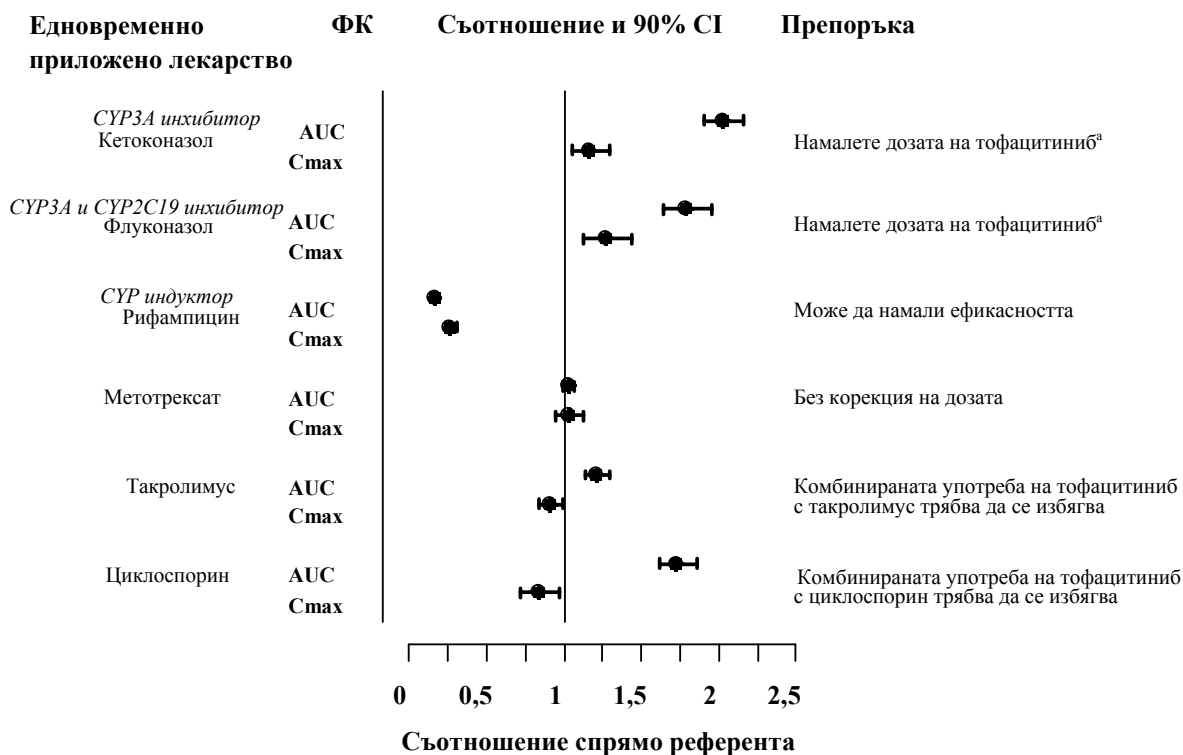
Фигура 1. Влияние на други лекарствени продукти върху ФК на тофацитиниб

Забележка: Референтната група е с приложение на тофацитиниб самостоятелно.