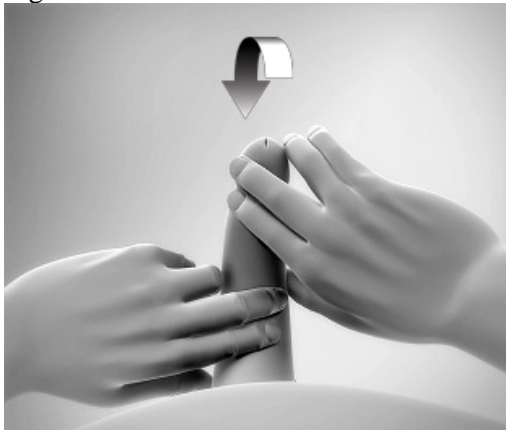
Figure 4: Ilustración de cómo enderezar el pene